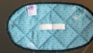
GINOCCHIERA SPALLIERA ANTIDOLORIFICA Bioceramica Fir®