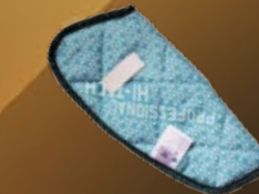
FASCIA RENALE ANTIDOLORIFICA Bioceramica Fir®