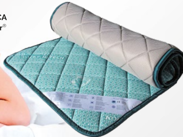
STUOIA ANTIDOLORIFICA Bioceramica Fir®